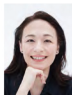
シルビア・グラブ