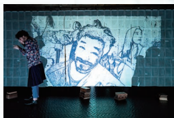
『巨匠とマルガリータ』2025

地点 Chiten 演出家・三浦基が代表をつとめる。多様なテキストを独自の手法によって再構成・カラーージュして上演する。言葉の抑揚やリズムをずらし、意味から自由になることでかえって言葉そのものを剥き出しにする手法は、しばしば音楽的と評される。2013年、本拠地・京都に廃墟状態の元ライブハウスをリノベーションしたアトリエ「アンダースロー」を開場。レパトリーの上演と国際プロジェクトを基軸に精力的に活動を展開。カイロ国際舞台芸術祭ベストセノグラフィ賞、読売演劇大賞作品賞ほか受賞多数。2022年、食堂「タツパウエイ」をオープン。