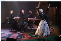
『ギンガンブラー』2026, Photo: The Coronet Theatre