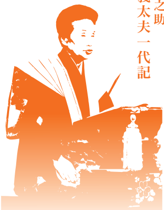
竹本駒之助 女流義太夫一代記